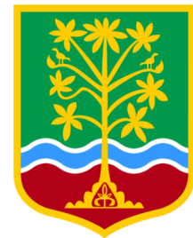
Grb Općine Centar Sarajevo

U okviru aktivnosti na projektu ReLOaD, ovom prilikom načelniku su uručena priznanja za ostvareni uspjeh i napredak u transparentnoj dodjeli sredstava organizacijama civilnog društva i za ostvareni uspjeh u uključivanju građana u procese donošenja odluka.