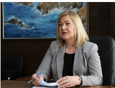
Jelka Milićević, federalna ministrica financija

- U prvom kvartalu 2021. prihodi od indirektnih poreza bili su manji za 13 posto, što je i očekivano, jer se privreda još nije oporavila na nivo od prvog kvartala prethodne godine - istakla je Milićević.