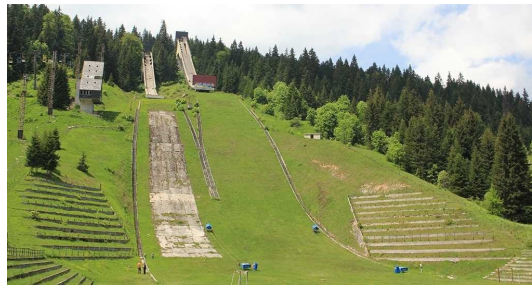
Malo polje, Igman

Na sjednici je razmatrana i inicijativa Komisije za očuvanje nacionalnih spomenika BiH, koja je pokrenula postupak za donošenje odluke o proglašenju Olimpijskih borilišta na Igmanu, Bjelašnici i Trebeviću (staze za olimpijski spust i veleslalom na Bjelašnici, staze za biatlon i skijaško trčanje na Igmanu, skakaonice na Malom polju na Igmanu, bob staza na Trebeviću) nacionalnim spomenikom BiH. Ovom odlukom bi se općinama Trnovo, Stari Grad, Hadžići i Ilidža onemogućilo provođenje vlastite (izvorne) nadležnosti i povrijedilo bi se pravo lokalne samouprave na odgovarajuće vlastite izvore financiranja, jer su ove općine vlasnici dijelova zemljišta, koji su predmet ovog postupka. Na taj način bi se proglašenjem Olimpijskih borilišta nacionalnim spomenikom BiH kršila prava općina Trnovo, Stari Grad, Hadžići i Ilidža zagarantirana Europskom poveljom o lokalnoj samoupravi, Zakonom o lokalnoj samoupravi FBiH i Zakonom o stvarnim pravima FBiH. Članovi Predsjedništva Saveza dali su potporu ovim općinama i otvoreno pozivaju Komisiju za očuvanje nacionalnih spomenika BiH na dijalog i sastanak po ovom pitanju, kako bi se osigurala zaštita prava i interesa jedinica lokalne samouprave, na koje bi eventualno donošenje ove odluke značajno utjecalo, te kako bi se raspravila sva otvorena pitanja između Komisije i jedinica lokalne samouprave u FBiH.